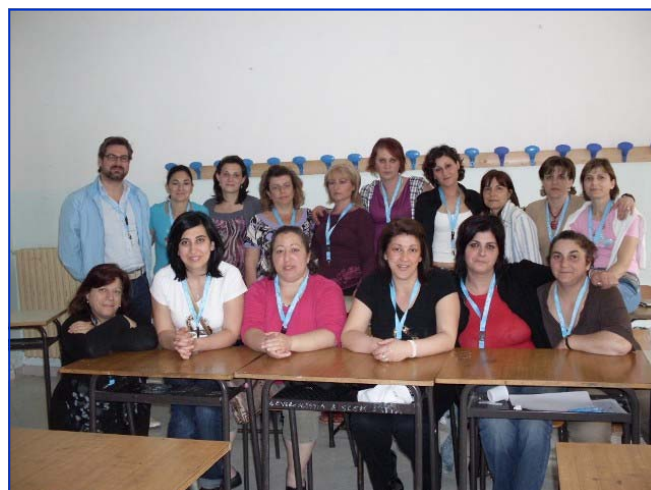
Genitori...In linea con mente e corpo!