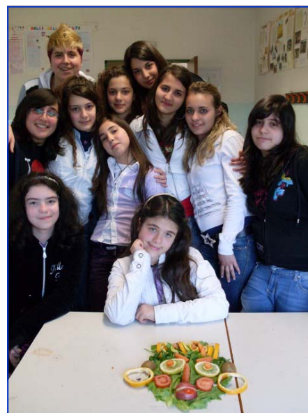
Ragazzi in linea con mente e corpo...