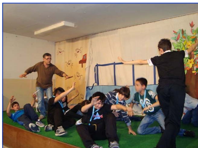
In sintonia...tra mente e corpo: su il sipario!