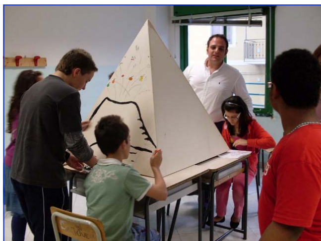
In sintonia tra mente e corpo

F1- FSE-2009-2442 "...In linea con mente e corpo!":